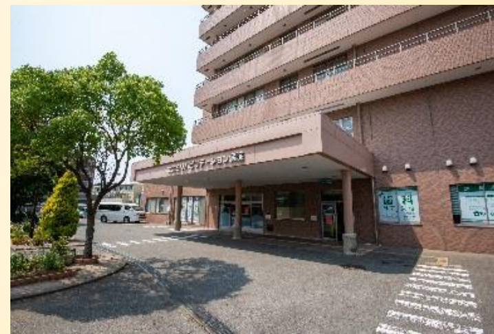
たたらリハビリテーション病院歯科