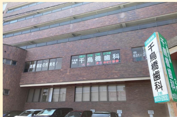
千鳥橋病院附属歯科診療所