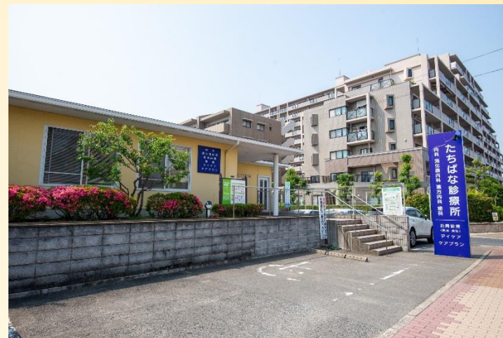
たちはな診療所歯科